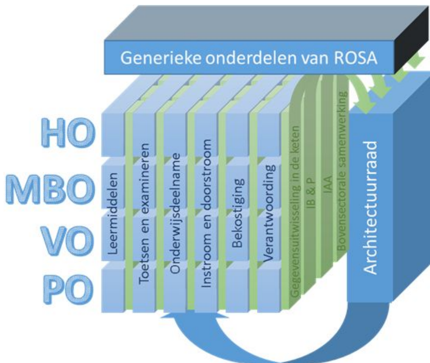
Afbeelding 2: Domeinen en thema's

Ook de huidige thema's Bovensectorale samenwerking , IAA , IBP en Gegevensuitwisseling in de keten uit ROSA blijven in deze opzet gehandhaafd. De Architectuurraad houdt zich op strategisch niveau met deze thema's bezig en geeft advies richting de domeinen. Op inhoudelijk niveau vindt uitwerking en ontwikkeling plaats in domeingroepen. Sommige thema's zouden separaat op domeinniveau kunnen bestaan, terwijl de inhoudelijke uitwerking van andere thema's wellicht uit alle domeingroepen gevoed wordt 2 . Generieke onderdelen van ROSA, die bijvoorbeeld vanuit de domeinen kunnen ontstaan, kunnen worden opgenomen in een domeinoverstijgende strategische paragraaf. Aan de hand van dit strategische deel kan vervolgens snel de impact van een (domein)project worden bepaald.