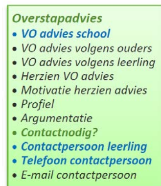
Figuur 4: Overzicht van gegevenselementen van de Overstapprofielen PO&VO m.b.t. Overstapadvies.