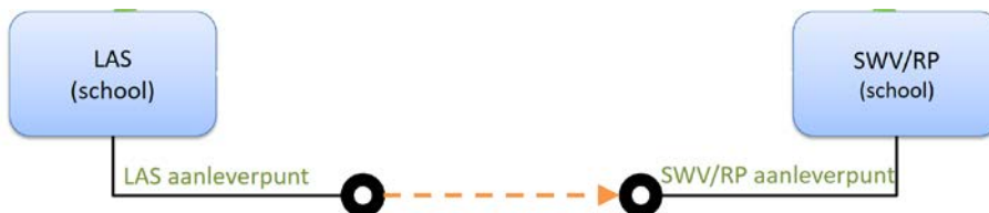
Figuur 2: OSO uitwisselingsproces van SWV-dossiers.

In onderstaand figuur is deze uitwisseling van een SWV-dossier weergegeven.