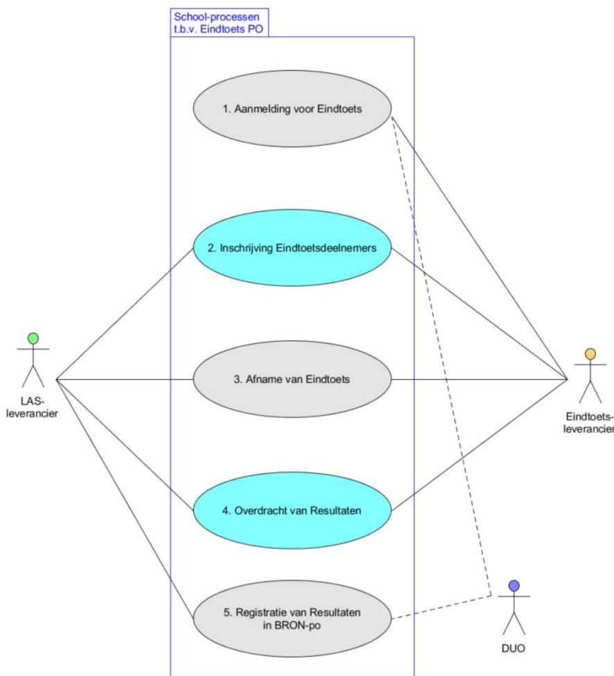
Figuur: Logistieke proces “Eindtoets”

Het logistieke proces “Eindtoets” rondom de verplichte Eindtoets PO omvat de volgende processen (zie bovenstaande figuur):