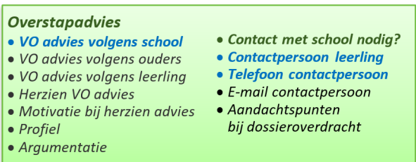
Figuur 3: Gegevenselement Dossier volgens Overstapprofielen PO&VO.

Vetgedrukt (groen) = verplicht in profiel, Blauw = conditioneel verplicht in profiel