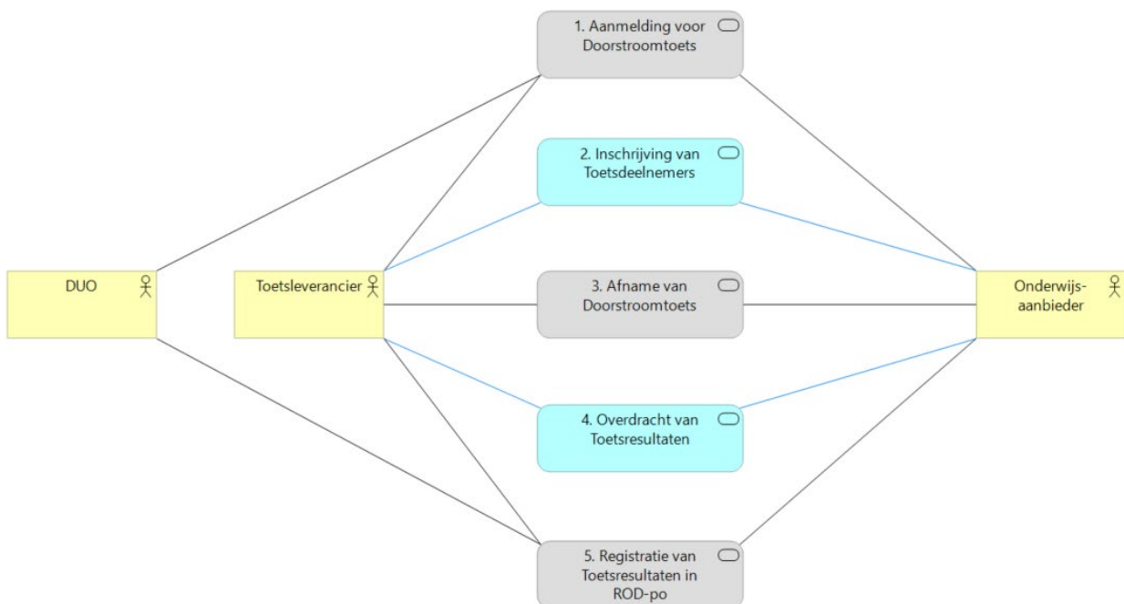
Figuur: Logistiek Proces Doorstroomtoets PO

Het logistieke proces “Doorstroomtoets PO” rondom de verplichte Doorstroomtoets PO omvat de volgende processen (zie bovenstaande figuur):