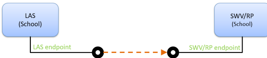
Figuur 2: OSO uitwisselingsproces van SWV-dossiers.

In onderstaand figuur is deze uitwisseling van een SWV-dossier weergegeven.