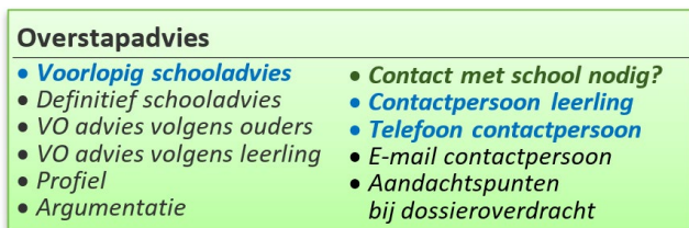
Figuur 3: Gegevens-element Dossier volgens Overstapprofielen PO&VO.

Vetgedrukt (groen) = verplicht in profiel, Blaauw = conditioneel verplicht in profiel